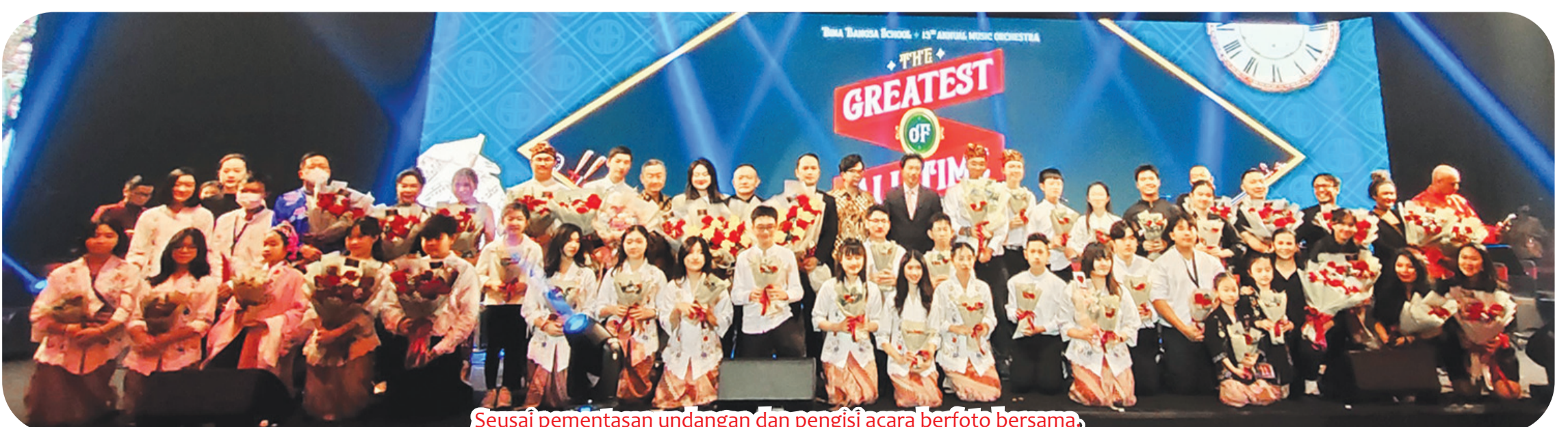
Seusai pementasan undangan dan pengisi acara berfoto bersama.