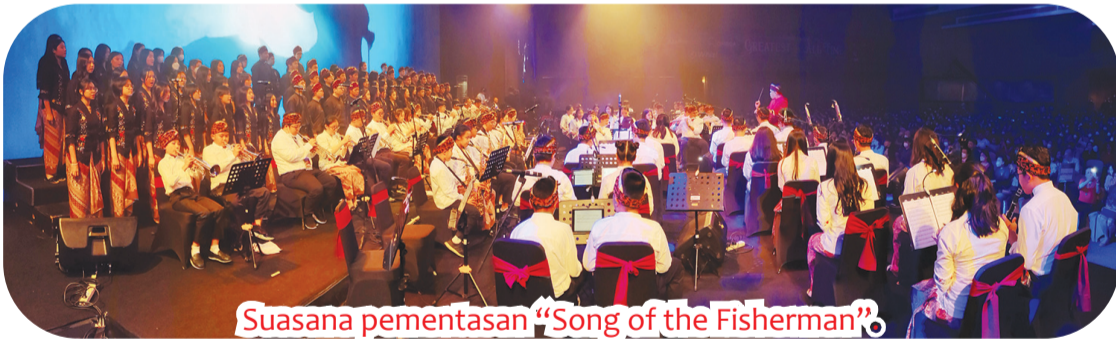
Suasana pentas "Song of the Fisherman".

Konser tersebut disaksikan lebih dari 800 penonton dan konser diakhiri dengan lagu "Zamrud Khatulistiwa". • harry/din