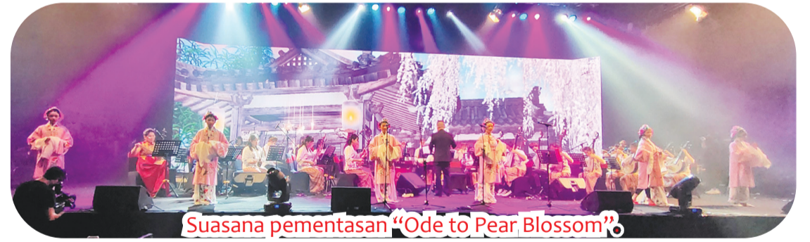
Suasana pentas "Ode to Pear Blossom".