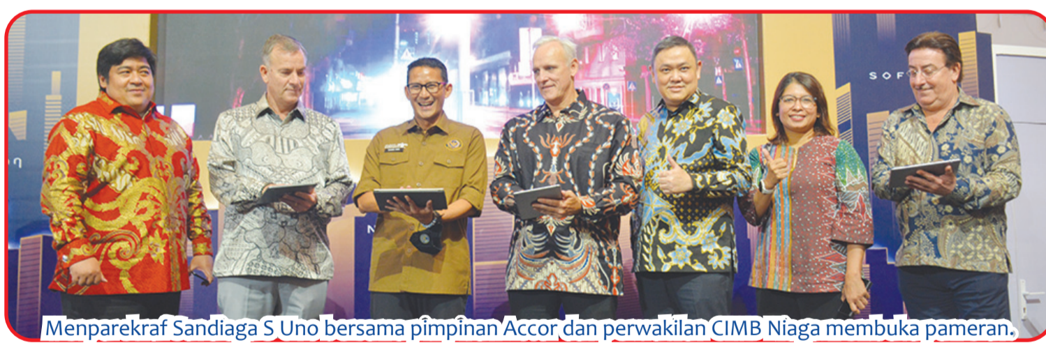
Menparekraf Sandiaga S Uno bersama pimpinan Accor dan perwakilan CIMB Niaga membuka pameran.

Serangkaian stan yang menawan dan mengundang, termasuk tema "Jungle Cruise," "Javanese Museum," "Beach