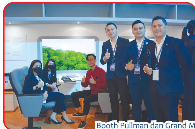
Booth Pullman dan Grand Mercure tampil di area pameran.

"City of ALL" edisi Jakarta, didukung oleh CIMB Niaga dan King Koil. ● kris