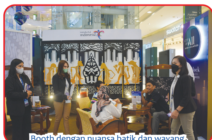
Booth dengan nuansa batik dan wayang.