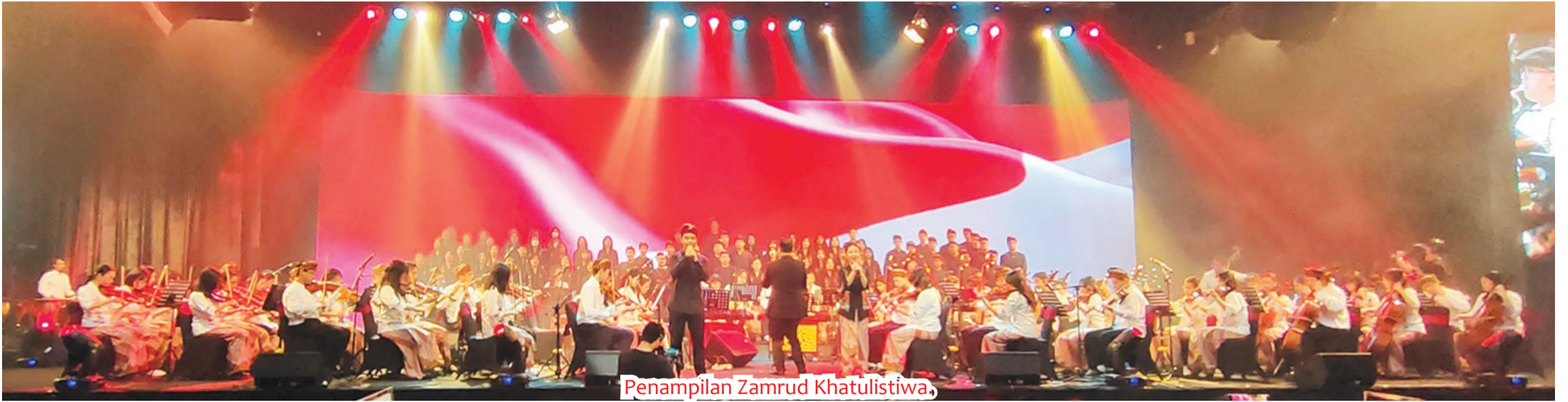
Penampilan Zamrud Khatulistiwa,