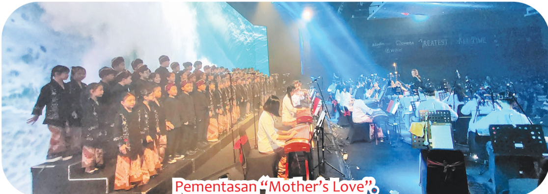
Pementasan "Mother's Love".