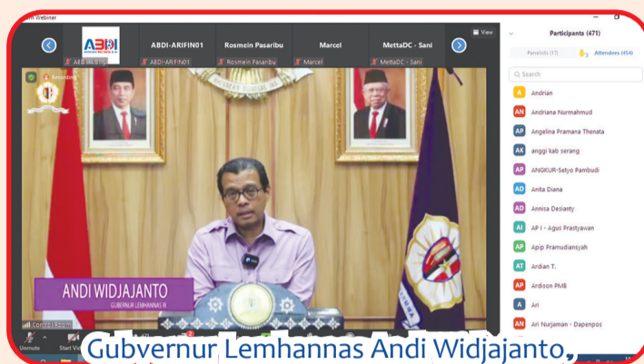
Gubernur Lemhannas Andi Widjajanto,