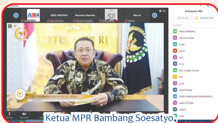
Ketua MPR Bambang Soesatyo,