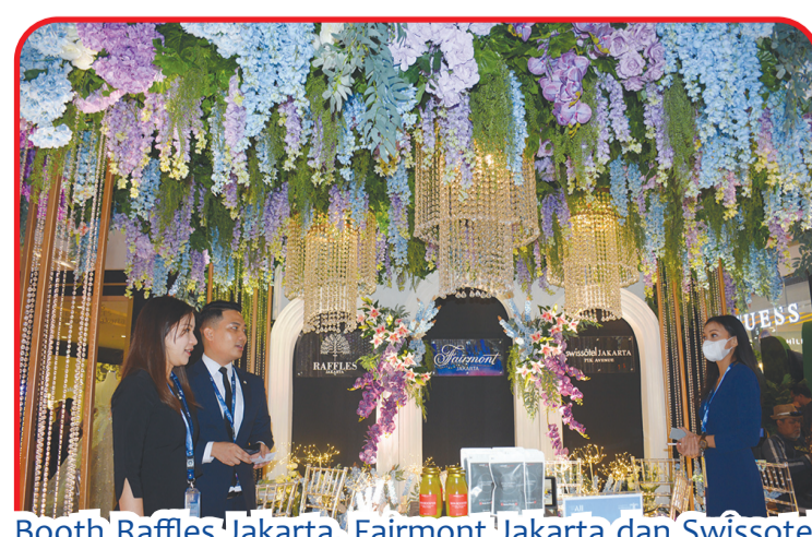
Booth Raffles Jakarta, Fairmont Jakarta dan Swissotel Jakarta - PIK Avenue.