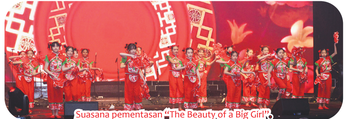
Suasana pentas "The Beauty of a Big Girl".